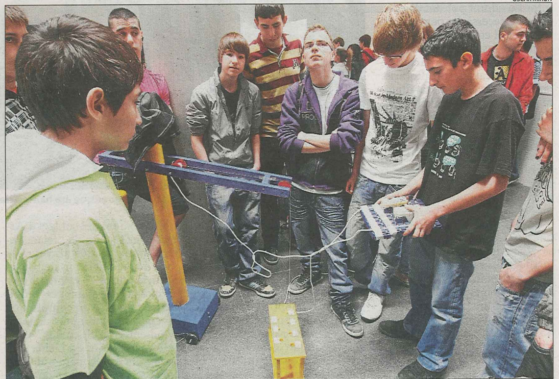
Un grup d'alumnes prova com funciona un dels invents.